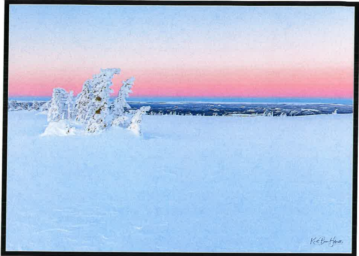
(Lagfjell mot øst, copyright Knut Høimseth, Trysil)