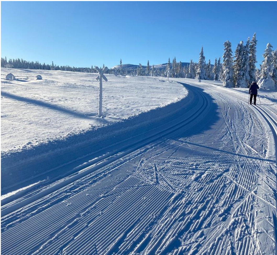
Fra den nye løypa på Fageråskjølen.